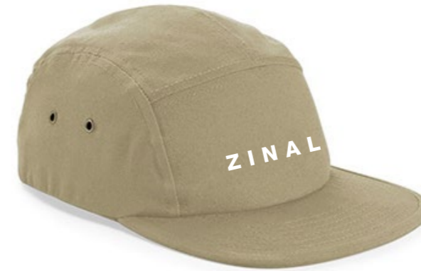
13A • NATURAL