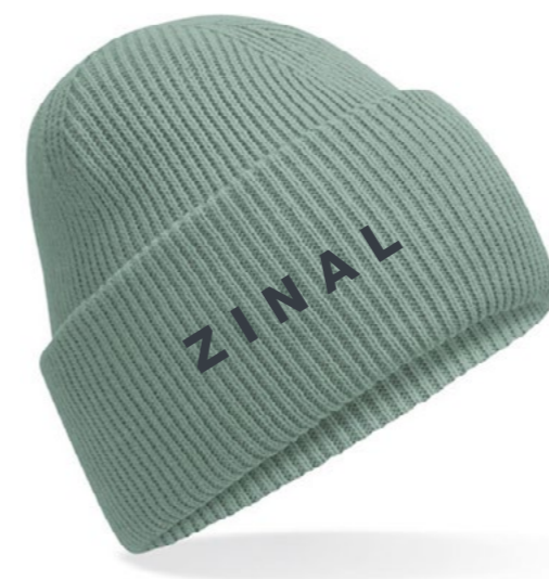
12C • ICEBERG