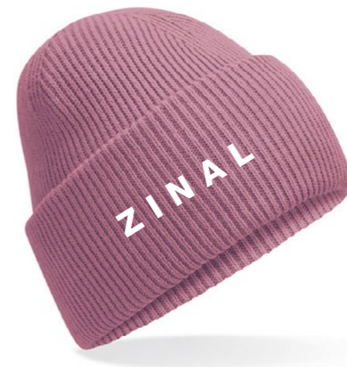
12A • PINK