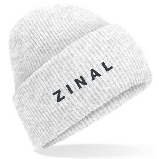
12D • ASH