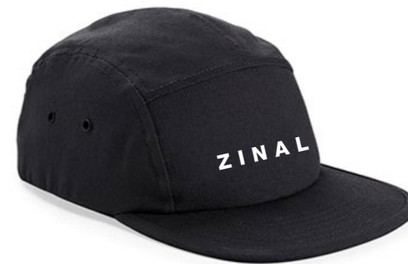
13C • BLACK