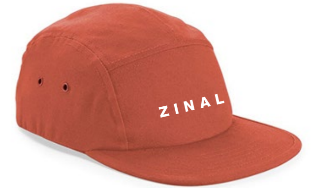
13B • TERRACOTTA