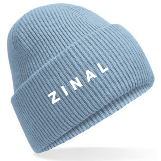
12B • BLUE