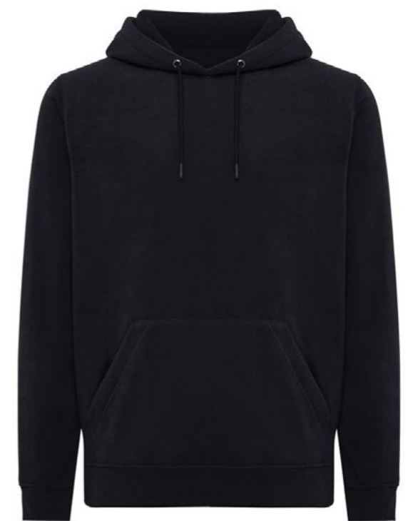
Ø3B • BLACK