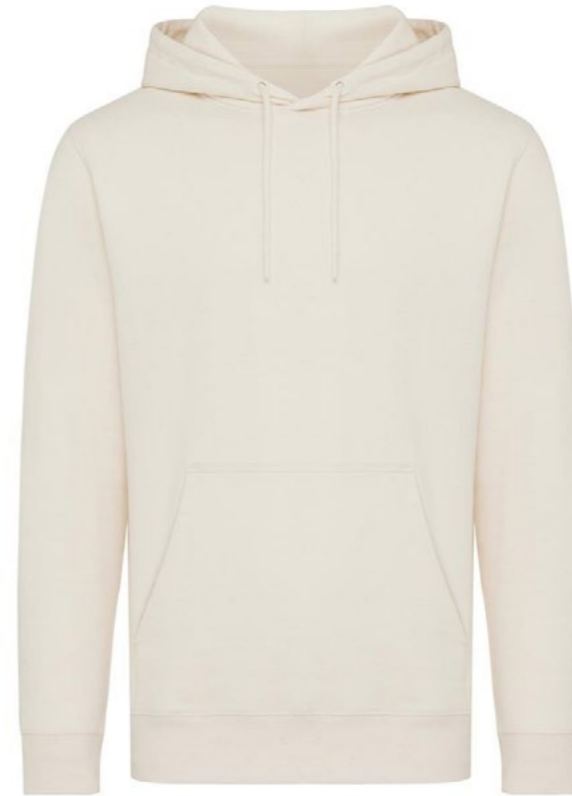
Ø1A • NATURAL