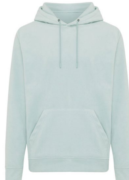
Ø3A • ICEBERG