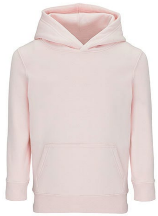
Ø7C • CREAMY PINK