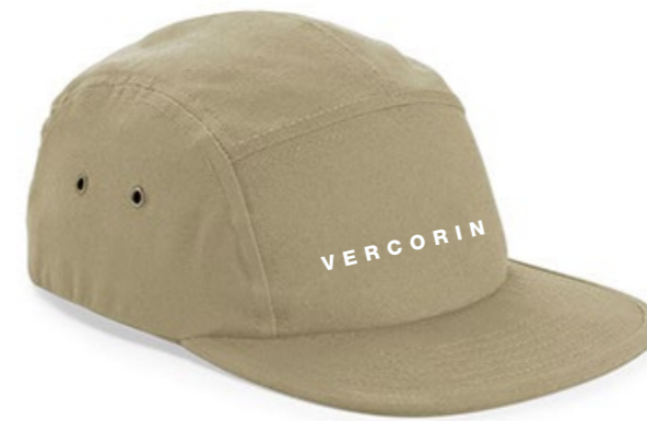
13A • NATURAL