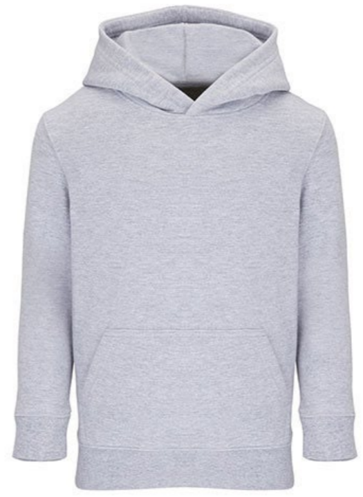
Ø7A • GREY