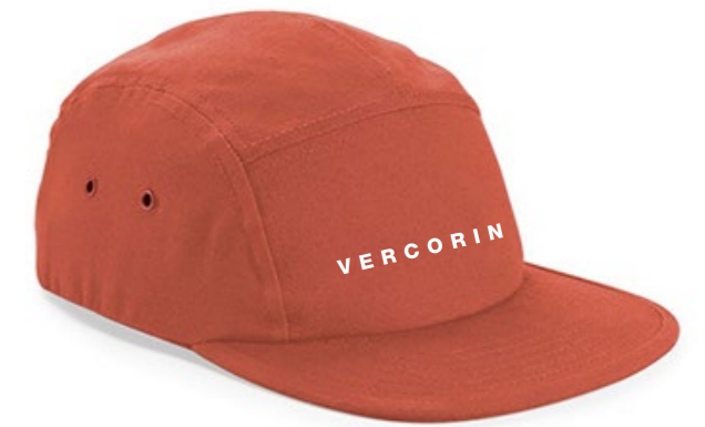
13B • TERRACOTTA