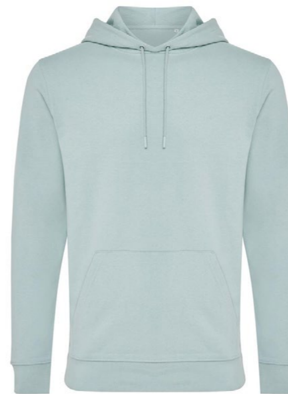
Ø1C • ICEBERG