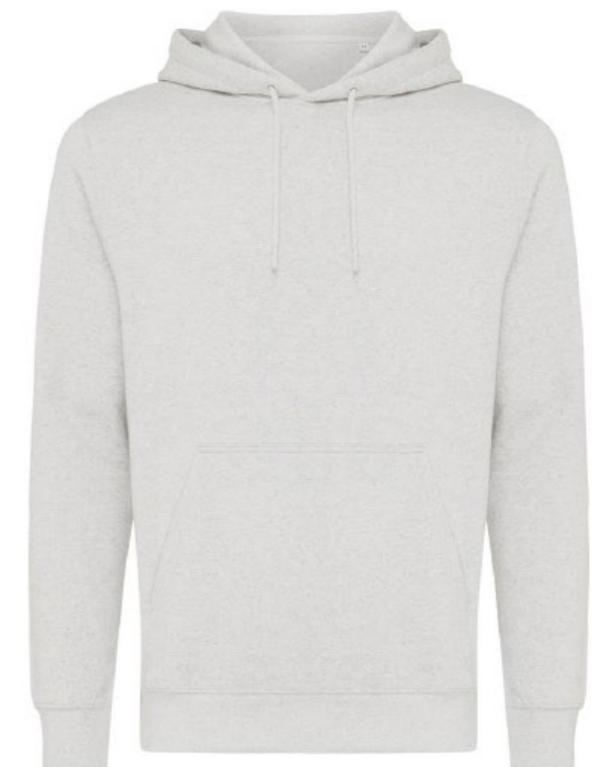
Ø1D • LIGHT GREY