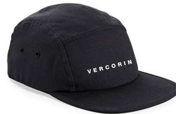
13C • BLACK