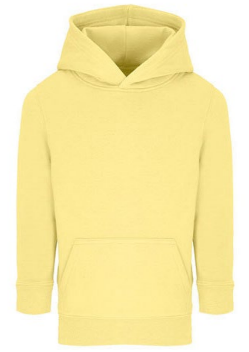
Ø7B • LIGHT YELLOW