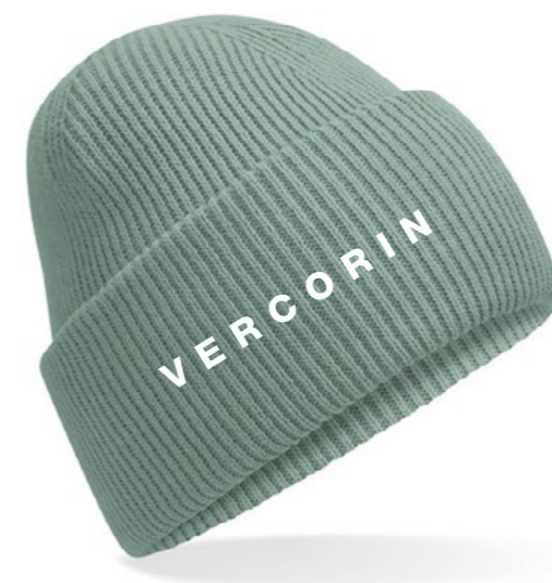
12C • ICEBERG