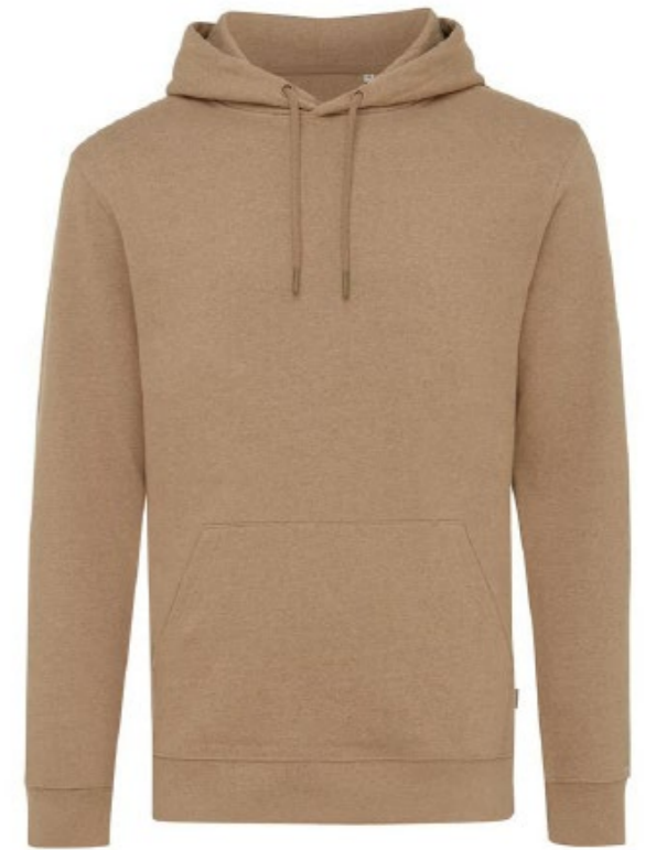
Ø2B • HEATHER BROWN