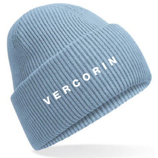
12B • BLUE