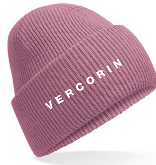
12A • PINK