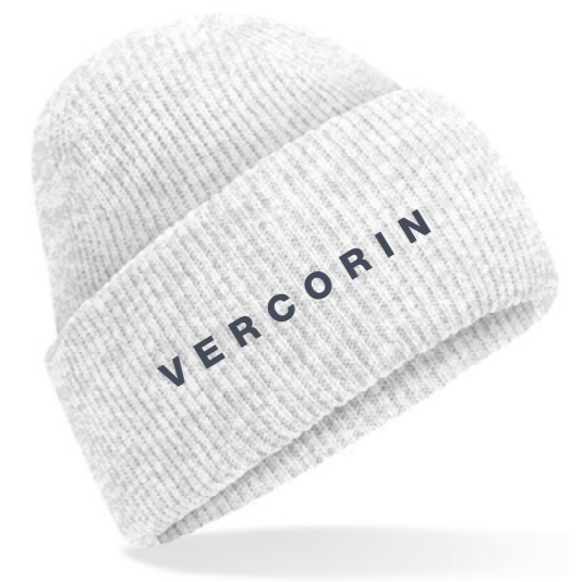
12D • ASH