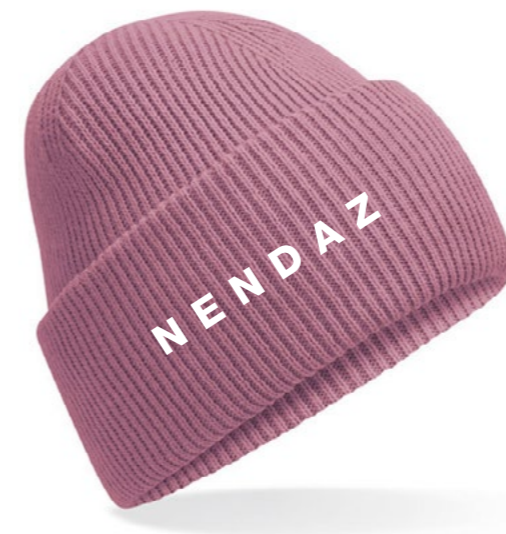
12A • PINK