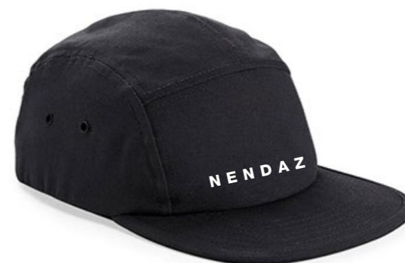
13C • BLACK