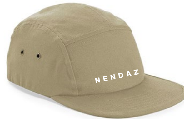
13A • NATURAL