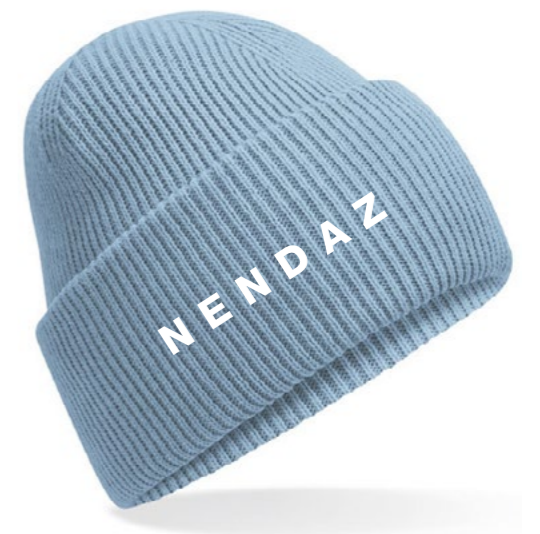
12B • BLUE