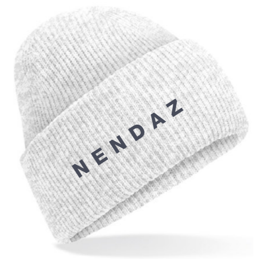
12D • ASH