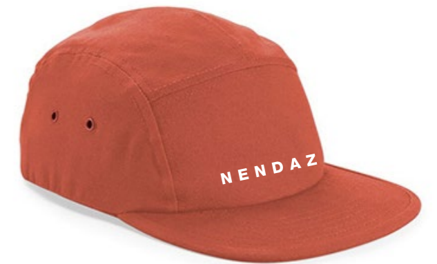
13B • TERRACOTTA