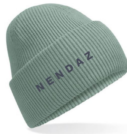
12C • ICEBERG