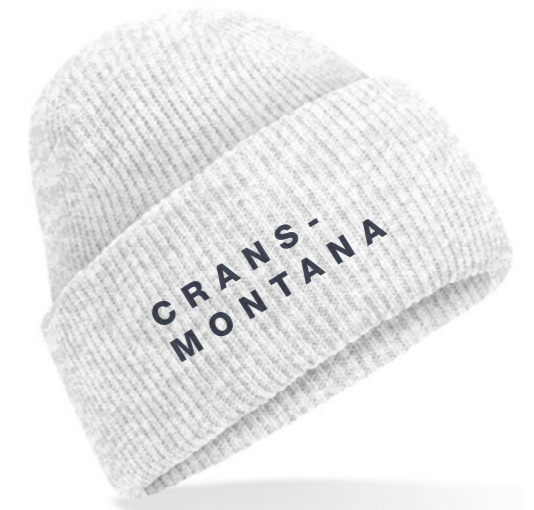
12D • ASH