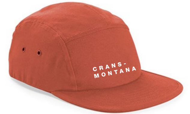
13B • TERRACOTTA