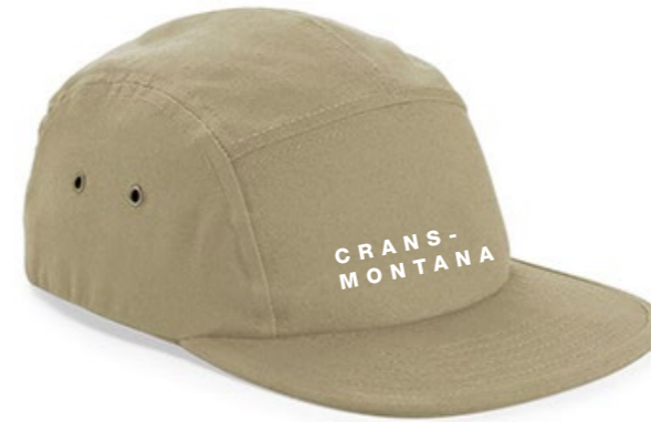
13A • NATURAL