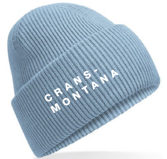
12B • BLUE