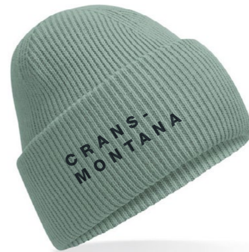
12C • ICEBERG