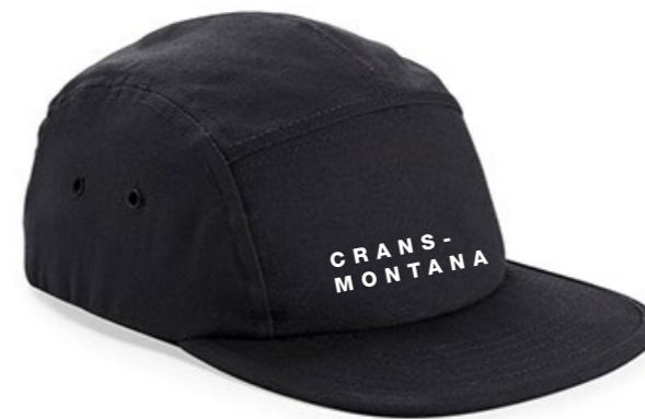
13C • BLACK