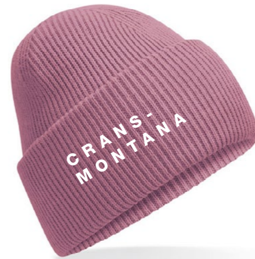
12A • PINK