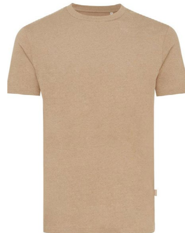
Ø4B • HEATHER BROWN