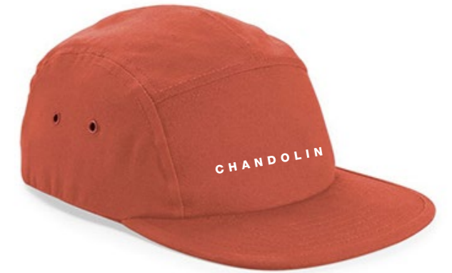
13B • TERRACOTTA