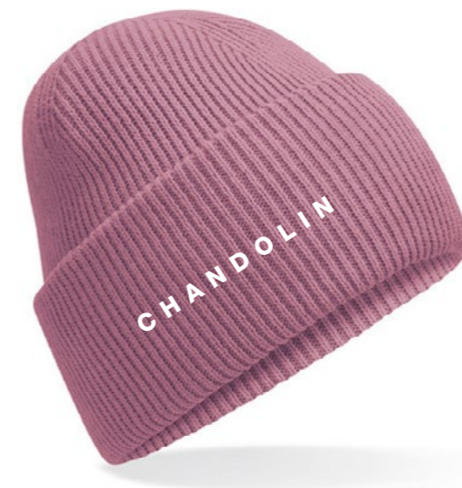
12A • PINK