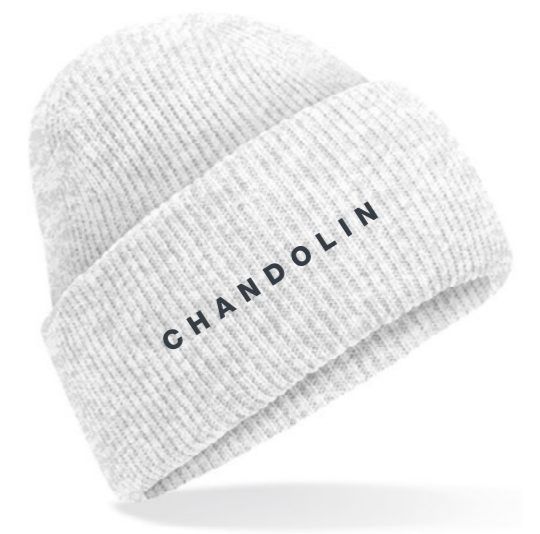
12D • ASH