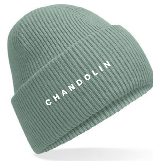
12C • ICEBERG