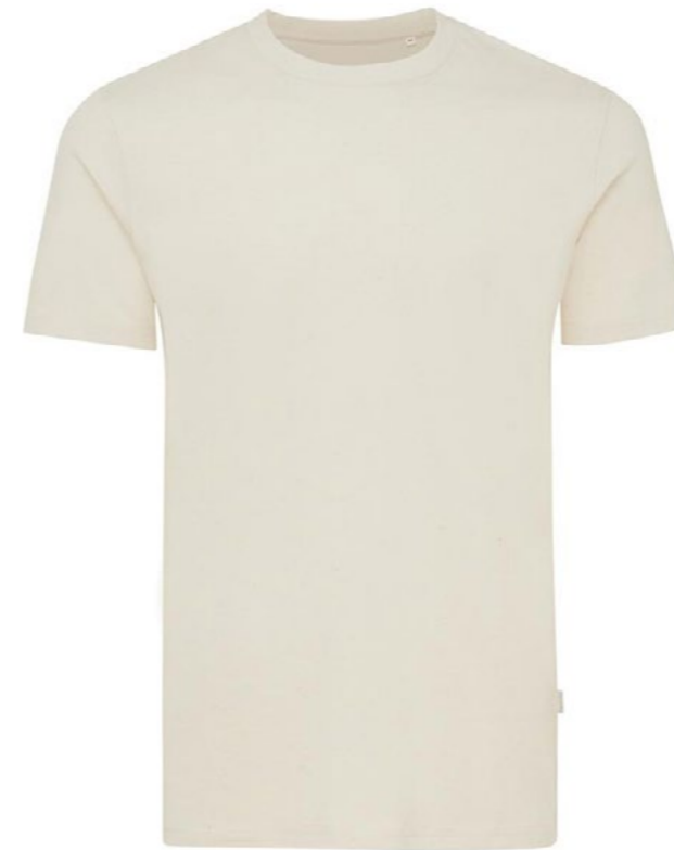
Ø4A • NATURAL