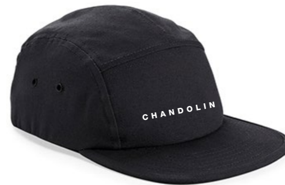
13C • BLACK