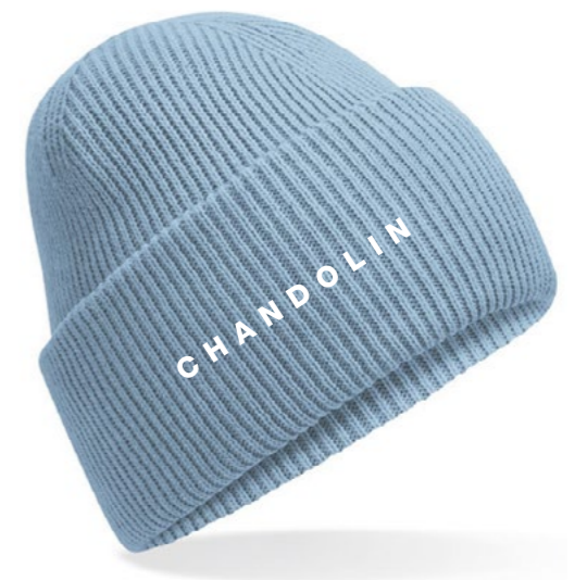
12B • BLUE