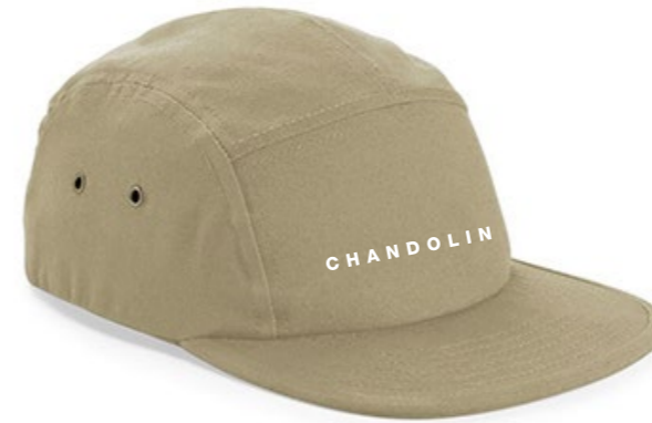
13A • NATURAL