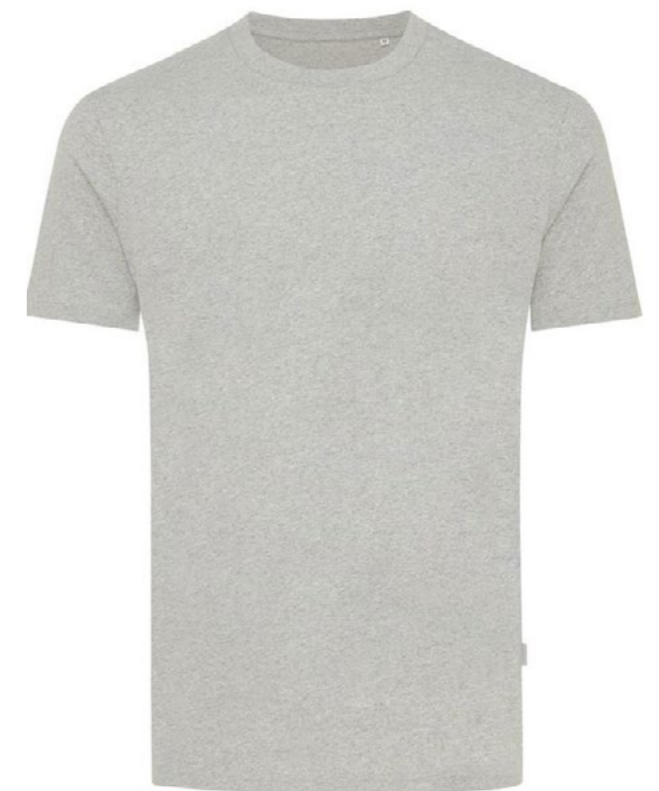
Ø4C • GREY